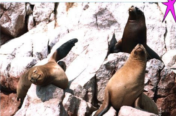
Seelöwen auf den Ballestas

Im eigenen Van mit Fahrer machen wir uns auf nach Paracas südlich von Lima gelegen. Die Fahrzeit beträgt ca. 4 Stunden. In Paracas übernachten wir für 2 Nächte im Resorthotel Paracas.