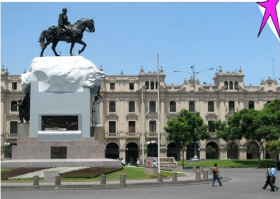
Plaza San Martín - Lima

Am Flughafen von Lima werden Sie erwartet von Markus Mathys und anschliessend persönlich ins Hotel im Stadtteil Miraflores begleitet. Nach dem Frühstück im Hotel steht der erste Tag im Zeichen der Anklimatisation und Erholung von der Anreise.