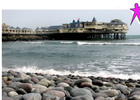
Restaurant La Rosa Nautica