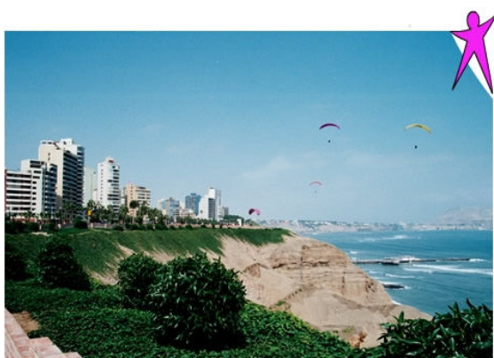
Blick auf die Costa Verde in Lima

Nach all den Besuchen und Erlebnissen steht nun schon der Rückflug von Puno nach Lima auf dem Programm. Nach der Rückkehr von Puno in den Anden geniessen wir nochmals die herrliche Aussicht von Miraflores in Lima auf die Costa Verde. Bei schönem Wetter und gutem Wind sind hier Paragleiter zu beobachten. In Lima zum Abschluss der Reise erwartet uns im Restaurant La Rosa Nautica, direkt am Strand ein idyllisches Nachtessen.