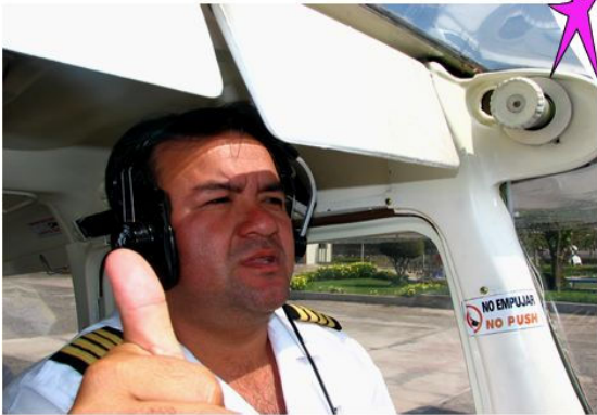
Flug über die Nascalinien

In Nazca morgens um 8 Uhr erwartet uns der Überflug über die Linien und Scharbilder von Nazca. Der Flug wird auf englisch oder spanisch vom Piloten selbst kommentiert. Die Kleinflugzeuge bieten Platz für 3 bis 5 Personen.