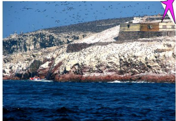
Vogelparadies auf den Islas Ballestas

Es besteht die Möglichkeit für Besuche von Museen, Ausgrabungsstätten und anderem mehr. Sie werden vor Ort ausführlich von Markus Mathys beraten.