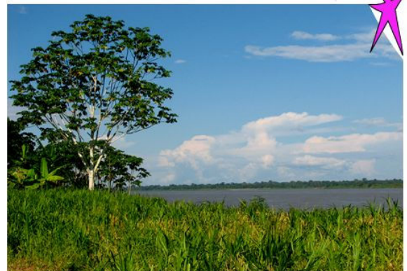
Landschaft am Amazonas

Nun folgt der Amazonas, für 3 Tage begeben wir uns auf einen Ausflug auf dem grössten Fuss der Welt. Untergebracht sind wir während dieser 3 Tage auf der Ceiba Top Luxury Lodges 40 km flussabwärts direkt am Hauptstrom des Amazonas.