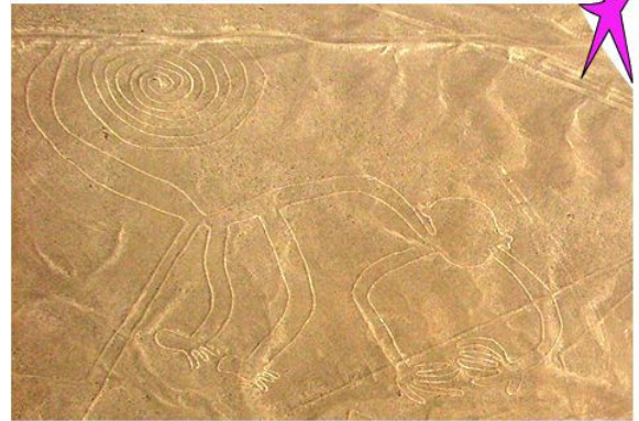
Scharbilder von Nasca - der Affe

Der Flug dauert ca. 30 min. und natürlich wird niemand gezwungen zu fliegen. Anschliessend an den Flug fahren wir zurück nach Lima.