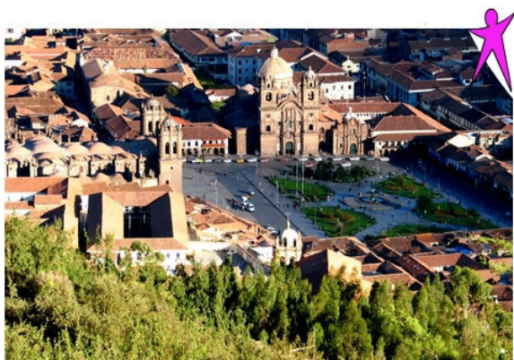
Blick auf die Plaza von Cusco

Natürlich besuchen wir auch die Stadt Cusco mit ihren zahlreichen Kirchen, Museen und Ruinen. Auch hier wird Sie Markus Mathys vor Ort genauestens informieren über die verschiedenen Möglichkeiten.