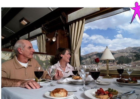
Im Luxuszug Hiram Bingham

Ein weiterer grosser Höhepunkt steht mit Machu Picchu nun auf unserem Reiseprogramm. Schon die Anfahrt nach Machu Picchu mit dem wohl luxuriösesten Zug von ganz Amerika, dem Hiram Bingham Luxuszug, wird ein ganz spektakuläres Erlebnis.