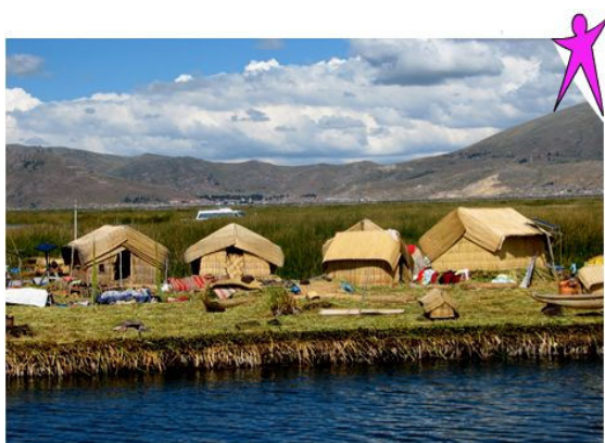
Schilfinseln der Uros

In Puno am Titicaca See besuchen wir am nächsten Morgen die schwimmenden Schilfinseln wo die Patenfamilie von Markus Mathys lebt. Weiter fahren wir hinaus auf den grossen Teil des Titicaca See zur Insel Taquile. Wir haben dafür ein privates Schiff, das uns für einen Tag zur Verfügung steht. So wird auch hier eine individuelle und flexible Tagesgestaltung möglich gemacht! Auf der Insel werden wir eine kurze Rundwanderung unternehmen und in einem lokalen Restaurant Mittagessen.