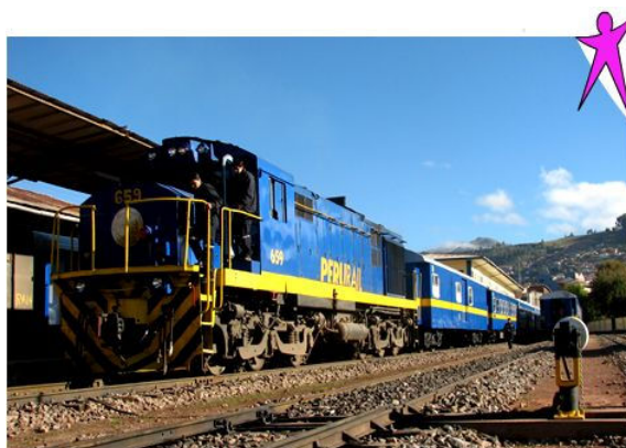
Andenbahn (Andene Explorer)

Die Rückfahrt von Machu Picchu nach Cusco bewältigen wir wieder im Luxuszug Hiram Bingham. Wie auf der Hinfahrt gibt es auch auf der Rückfahrt ein Dreigang-Menue.